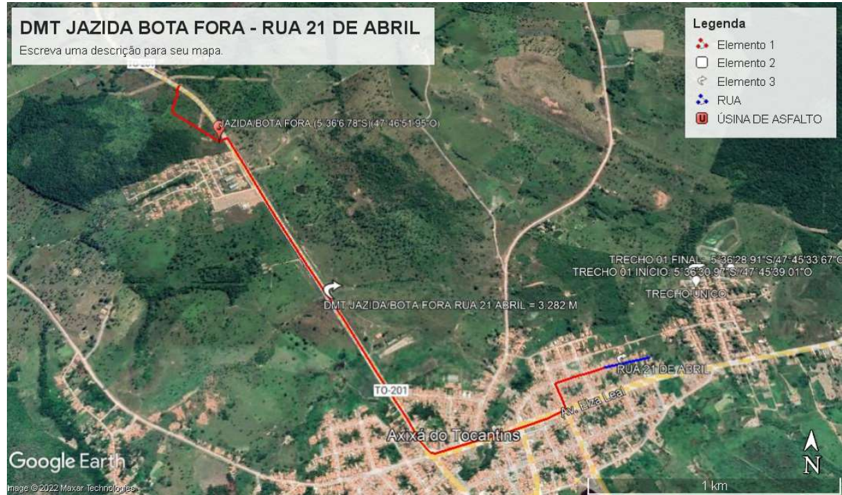
Imagem 01: DMT da Cascalheira até a Região – 01 (Rua 21 de Abril e ruas próximas): 3,20km.