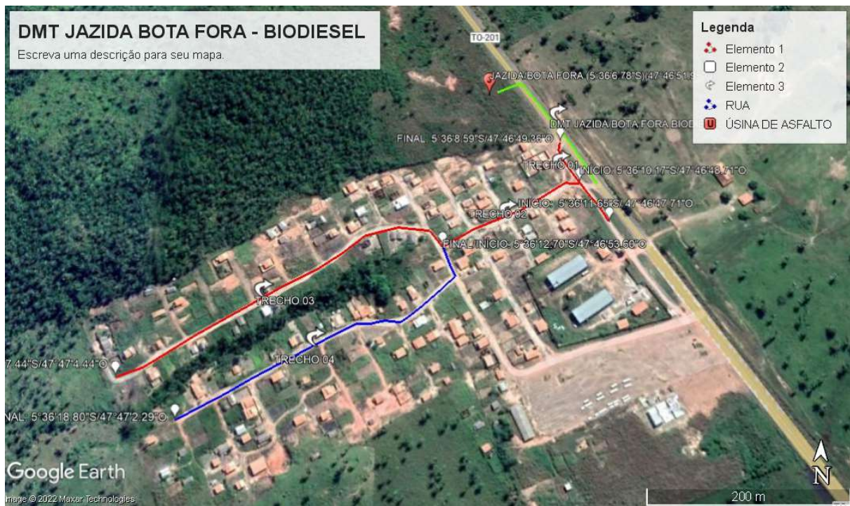
Imagem 05: DMT da Cascalheira até a Região – 05 (Biodiesel): 0,60km.

Axixá do Tocantins - TO, 27 de fevereiro de 2023.