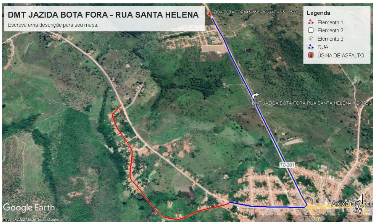
Imagem 03: DMT da Cascalheira até a Região – 03 (Rua do Santa Helena e ruas próximas): 3,60km.